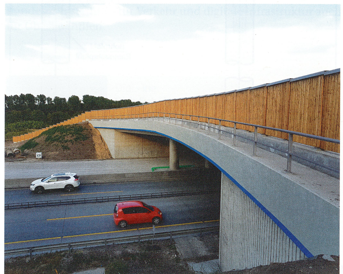
Bild 1 Irritationswand auf einer Querung der A7 bei Brokenlande.

Damit die Tiere diese Querungshilfen auch finden werden Irritationsschutzeinrichtungen daneben und darauf errichtet. Diese finden jedoch nicht immer Akzeptanz in der Bevölkerung, sodass sich Bauverwaltungen oft Kritik gefallen lassen müssen.