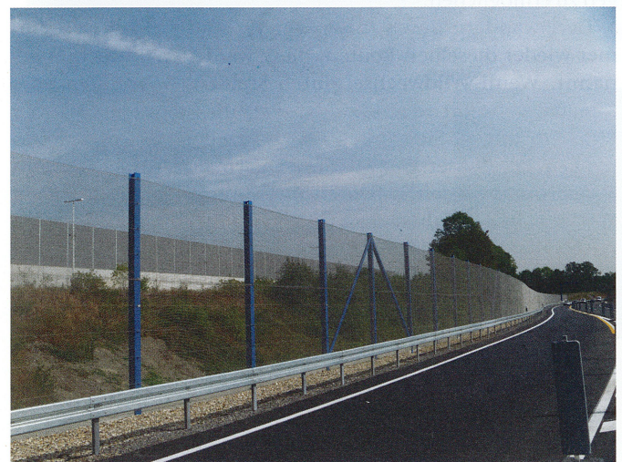
Bild 5 Beispiel einer Fledermausüberflughilfe an der A44 bei Witten mit 25*25 Maschendrahtgeflecht.