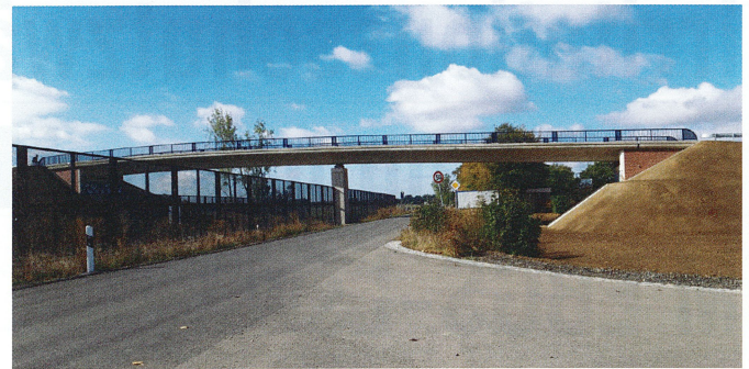
Bild 3 Kollisionsschutzwand an der B6 bei Kobbensen mit 30*30 Wellendrahtgitter im Stahlrahmen